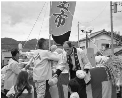
▲宝船から野菜をプレゼントするJA役員

10 月18日と19日の両日、榛名支所をメイン会場に「榛名ふるさと祭り」が開催されました。JAはぐくみは19日に農産物即売会「ふれあい市」と野菜の無料配布「宝船」を行いました。JAの役員らがハクサイ、キャベツ、ダイコンなどを積み上げた「宝船」に乗り込み、来場者に手渡し。地域住民と交流しながら、安全安心な野菜をPRしました。