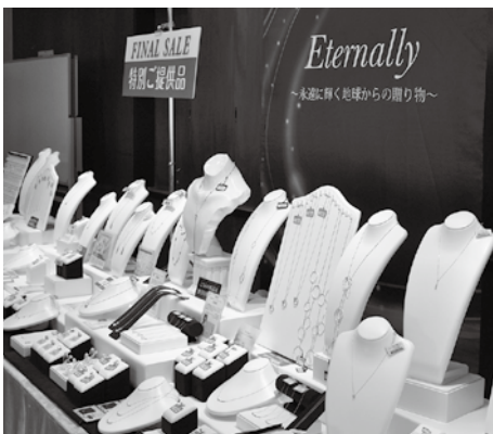
▲光り輝くジュエリーがずらり

月10日、11日の2日間JAはぐくみ本店3階で「ふれあいジュエリー展」を開催しました。2日間で約200人が来場。会場ではペンダントや指輪、ネックレスをはじめ、健康ジュエリー、スーツ、バッグなど多彩な商品の販売を行いました。また、ジュエリークリニックでは、持参したジュエリーの修理・クリーニングや作り替えを行う「リ・ジュエリー」など、特別企画も合わせて実施しました。